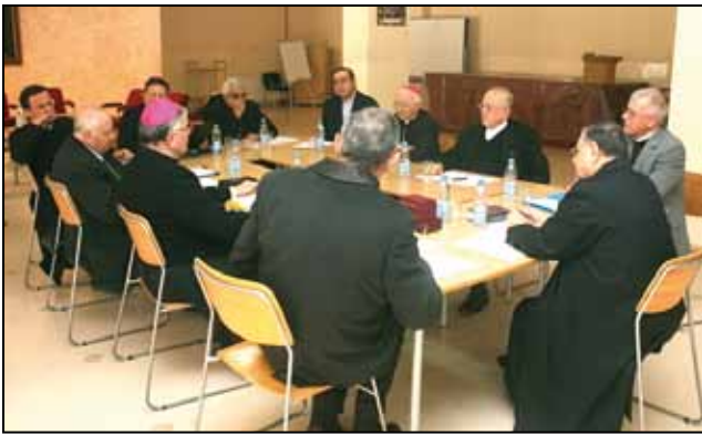
ההגמונים הלטינים בעמאן

ב-19 בספטמבר 2009, בשעת נאומו בפני הפטריארכים הקתולים של המסורות השונות הנמצאות באזורנו, האפיפיור ברוך (בנדיקטוס) ה-16 הודיע שיתקיים סינודוס (אספת הגמונים) מיוחד לכנסיה הקתולית במזרח התיכון ברומא בין ה-10 ל-24 באוקטובר 2010. הקווים המנחים לקראת עריכת הסינודוס פורסמו באמצע חודש ינואר ונשלחו לכל ראשי הכנסיות בשעה שהוטלה עליהם משימה ללקט את תגובות המאמינים. הנושא הכללי שנבחר לסינודוס "אחדות ועדות" מתבסס על הפסוק: "קָהַל הַמַּאֲמִינִים הָיָה לֵב אֶחָד וְנַפְשׁ אֶחָד" (מעשי השליחים ד:32). השאלות שעליהן היו צריכים לענות