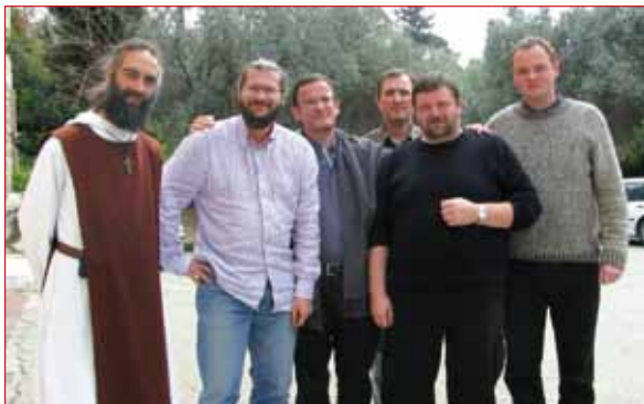
תמונה: כמה מחברי הוועד לדוברי הרוסית

שישנן עוד משפחות שמעוניינות להתפלל בעברית. הנזירים והנזירות העובדים בבית החולים קיבלו בברכה את היוזמה הזאת ואף משתתפים בתפילה כשעיסוקיהם הרבים מאפשרים זאת. – אנחנו גם ממשיכים להתעניין בגורלם של ילדי העובדים הזרים והפליטים הקתוליים שחיים בישראל ומשולבים בבתי הספר היהודיים העבריים. ילדים אלה מתפללים בקהילות הדוברות את שפת הוריהם אולם הילדים הינם דוברי עברית וכן זקוקים לשיעורי דת ופעילויות בעברית. כניסיון ראשון, האב דוד החל לתת שיעורי דת לקבוצה של כ-25 ילדים בקפלה שהוקמה לפיליפינים באזור התחנה המרכזית בתל אביב.